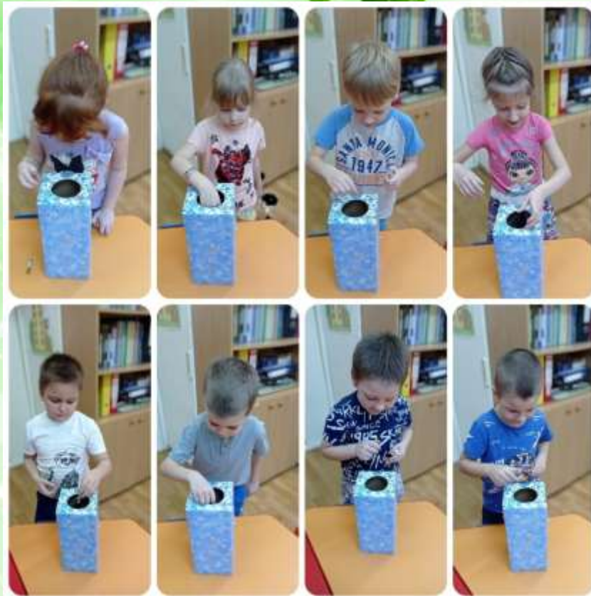
Акция «Сбор батареек»