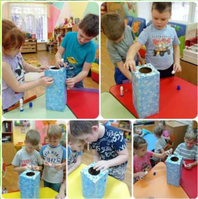
Украшаем коробку для батареек